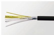
25G高周波伝送ケーブル